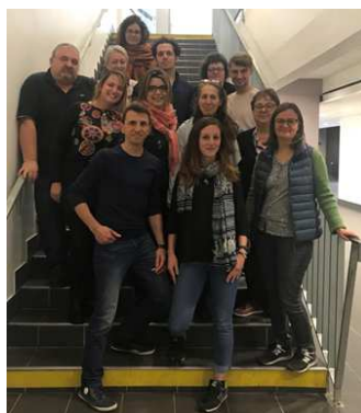
Promotion du Master Sciences Cliniques en Soins Infirmiers 2016-2018

Infirmières et infirmiers de diverses spécialités (de l'oncologie à la psychiatrie en passant par les soins à domicile et le palliatif), nous avons entrepris un Master de Sciences Cliniques en soins infirmiers en septembre 2016. Notre volonté de développer et mettre en valeur la pensée propre infirmière, d'élargir nos horizons et d'être facteurs de changement des paradigmes de soins nous a fait choisir le nom de Pionniers pour représenter notre promotion.