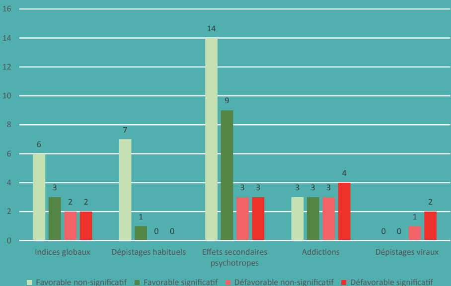
Figure 2. Evolution des indicateurs 2009-2014 selon leurs grandes catégories d'appartenance.

Exemple de lecture : Sur les 13 indicateurs d'indices globaux recherchés par les audits, 9 sont mieux renseignés en 2014 qu'en 2009 (il y a plus de dossiers où l'information est présente la 2e année que la 1ère), 6 de manière significative et 3 de manière non significative.