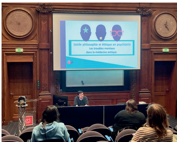
Soirées Les troubles mentaux dans la médecine antique