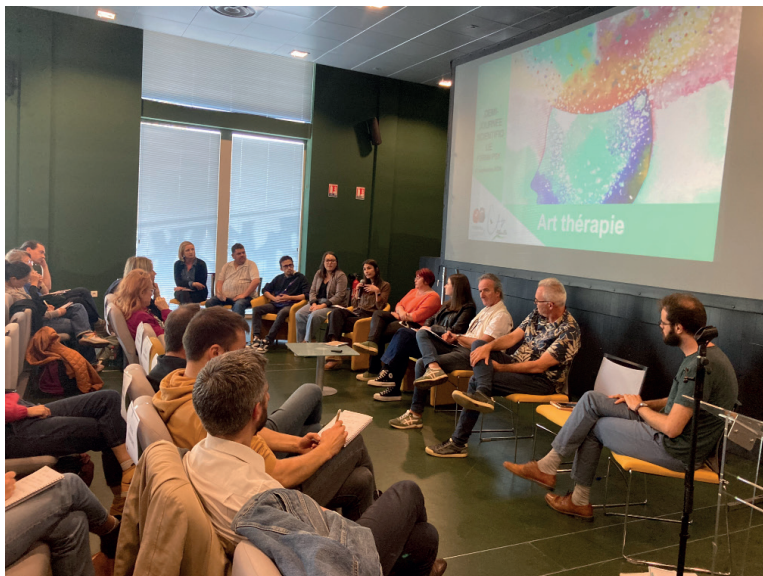
Demi-journée L'art-thérapie en psychiatrie à Abbeville