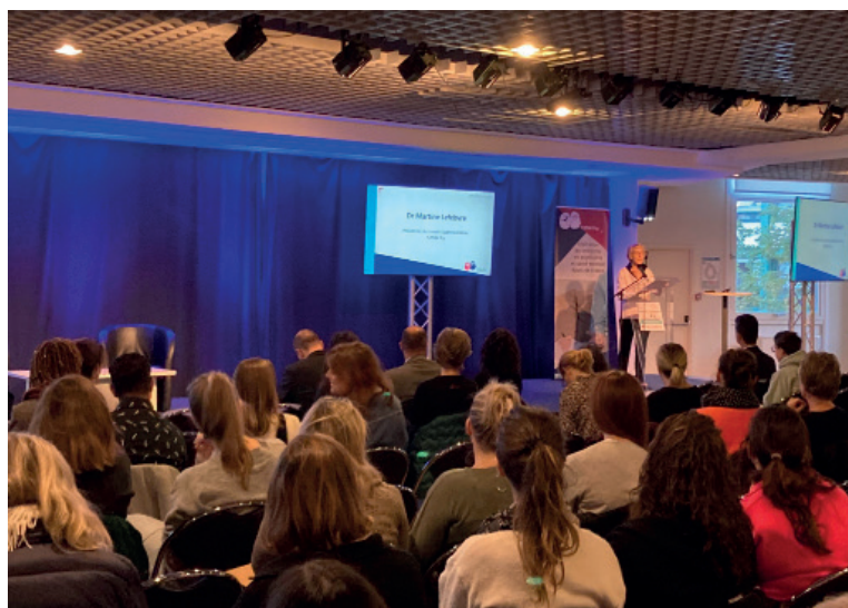
Journée scientifique Psychotropes